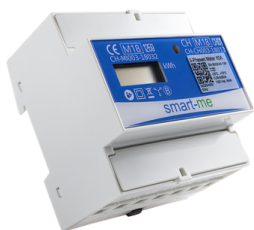
3-Phasen Aufrüstset CHF 398.00