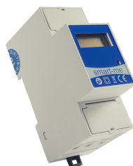
1-Phasen Aufrüstset CHF 204.00